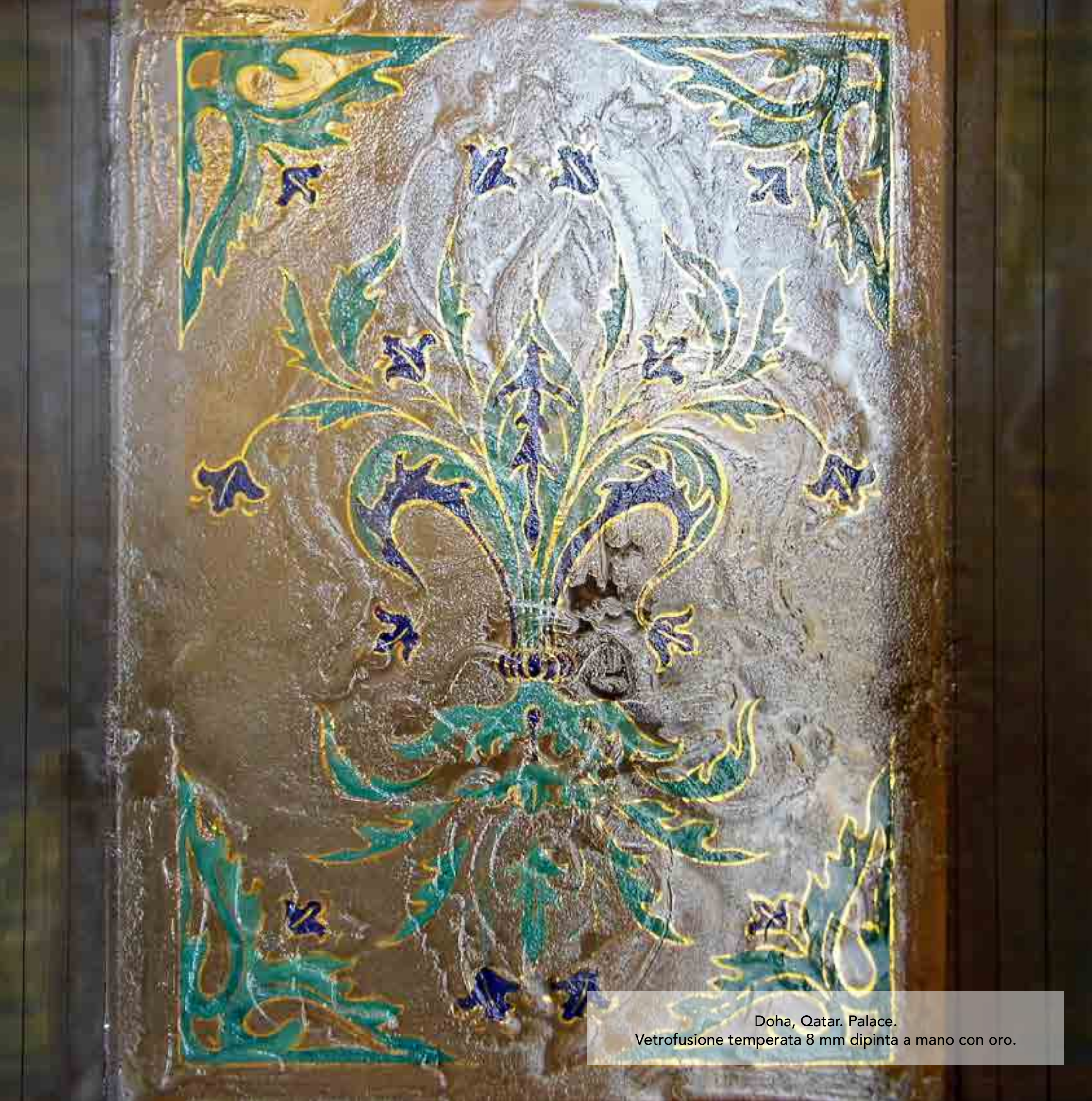
Doha, Qatar. Palace. Vetrofusione temperata 8 mm dipinta a mano con oro.