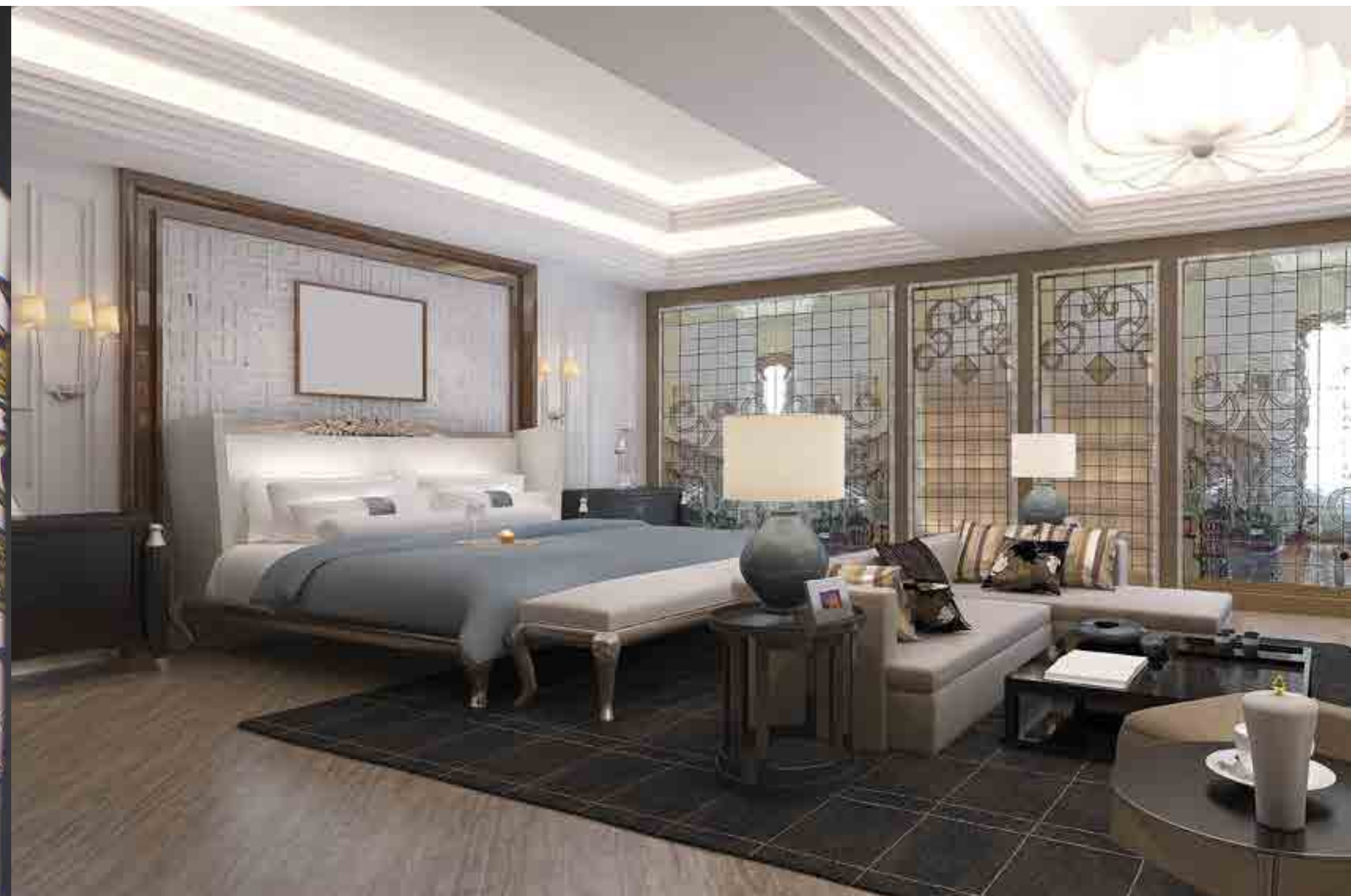
Vetro rilegato a piombo.