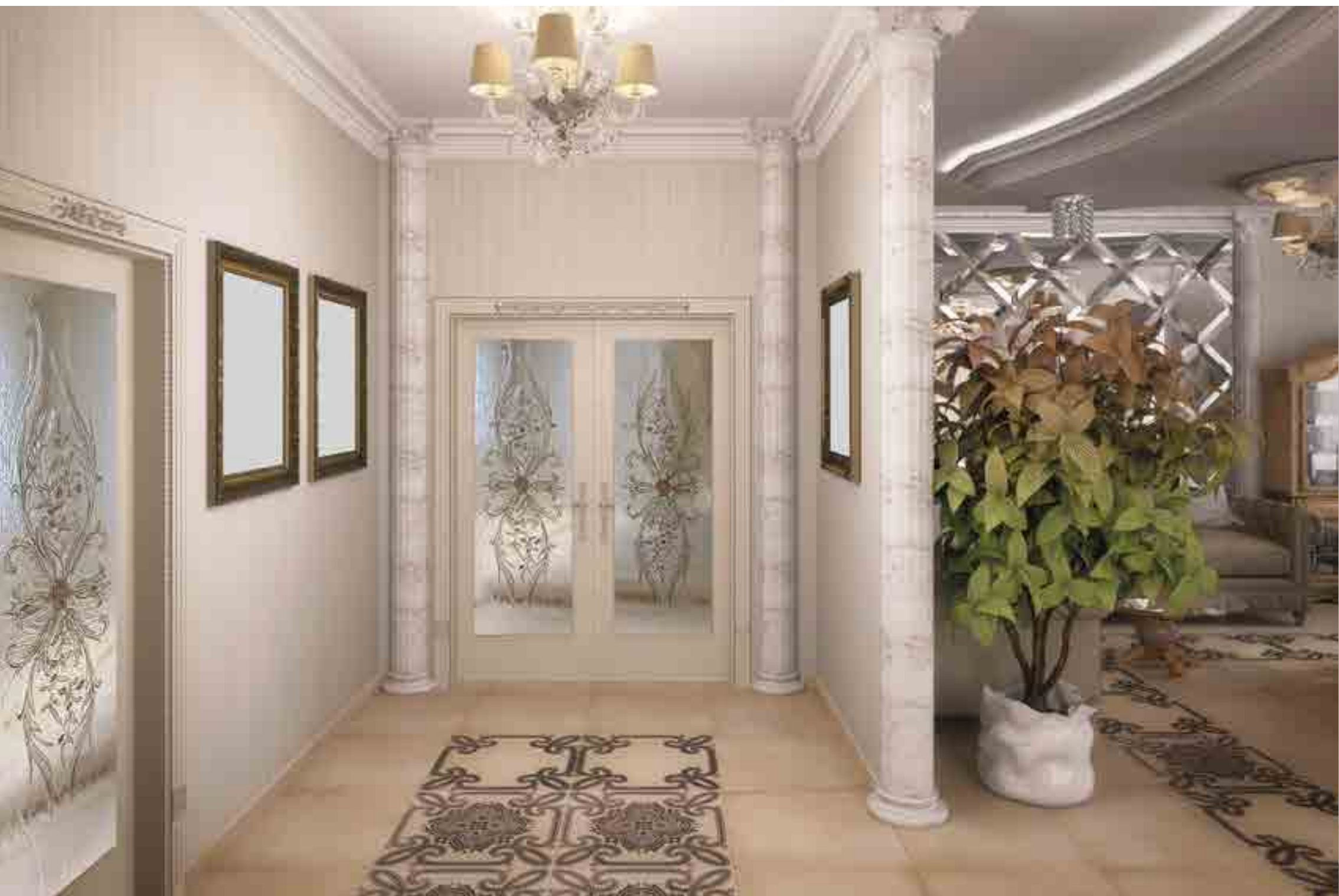
Vetrofusione temperata neutra, decoro stile natura.