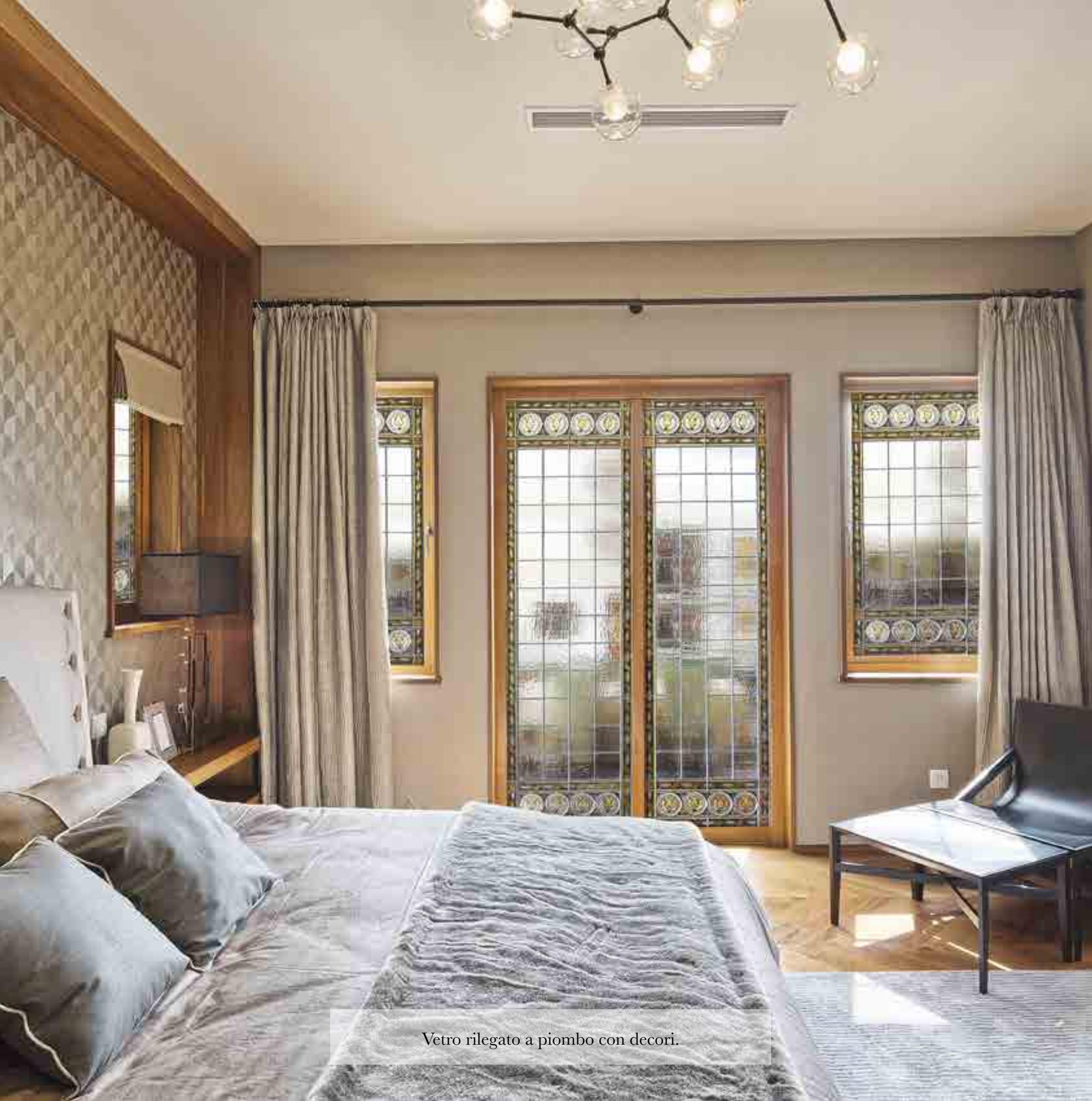
Vetro rilegato a piombo con decori.