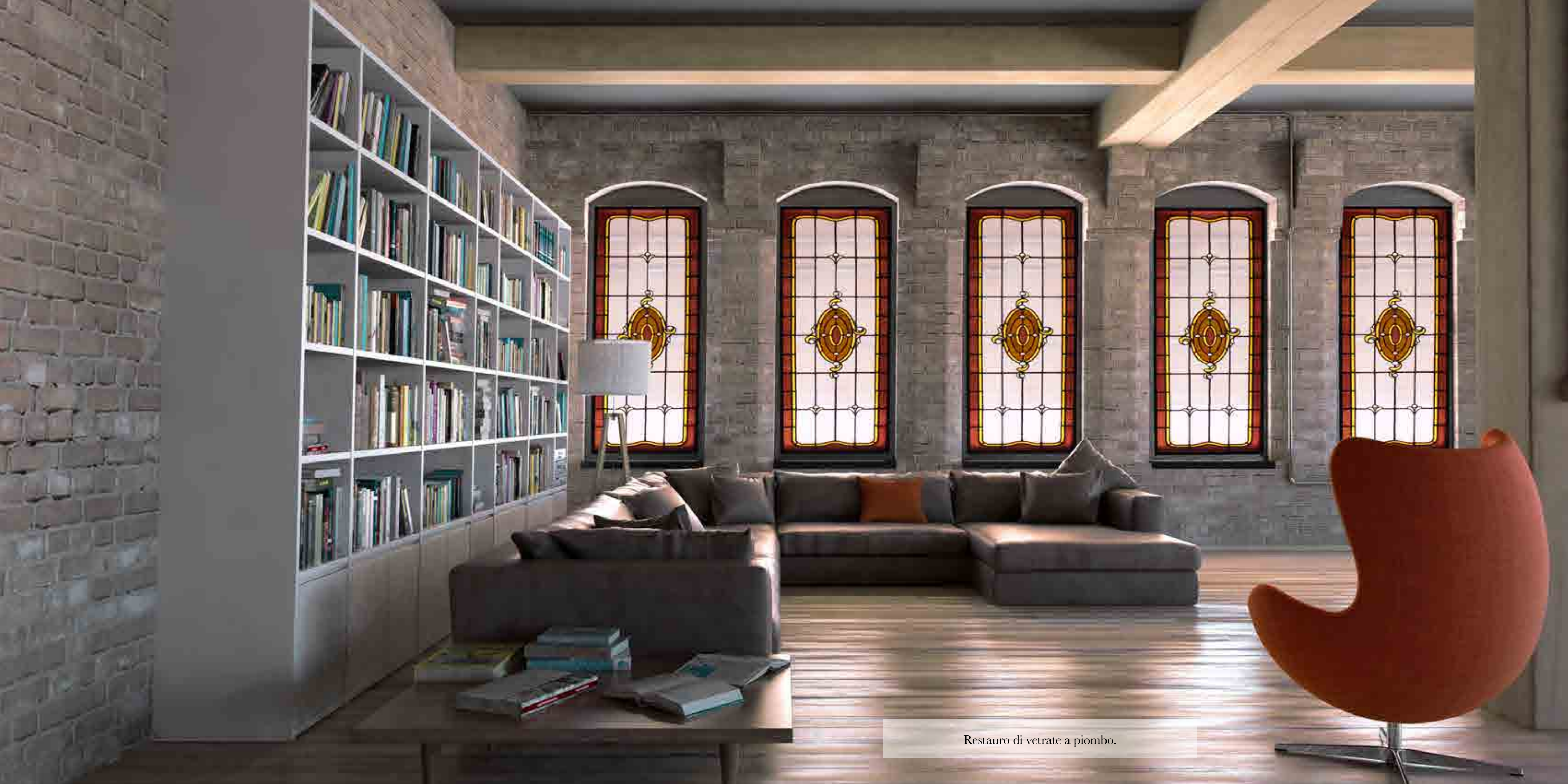
Restauro di vetrate a piombo.