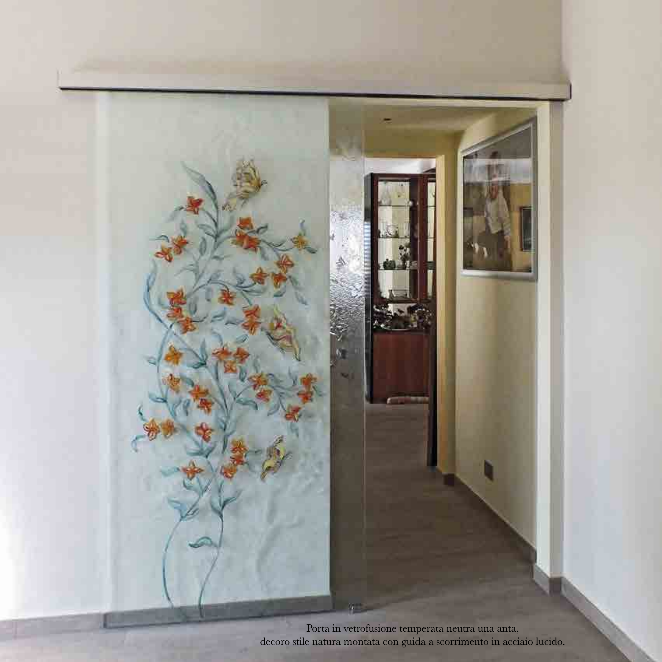
Porta in vetrofusione temperata neutra una anta, deco stile natura montata con guida a scorrimento in acciaio lucido.