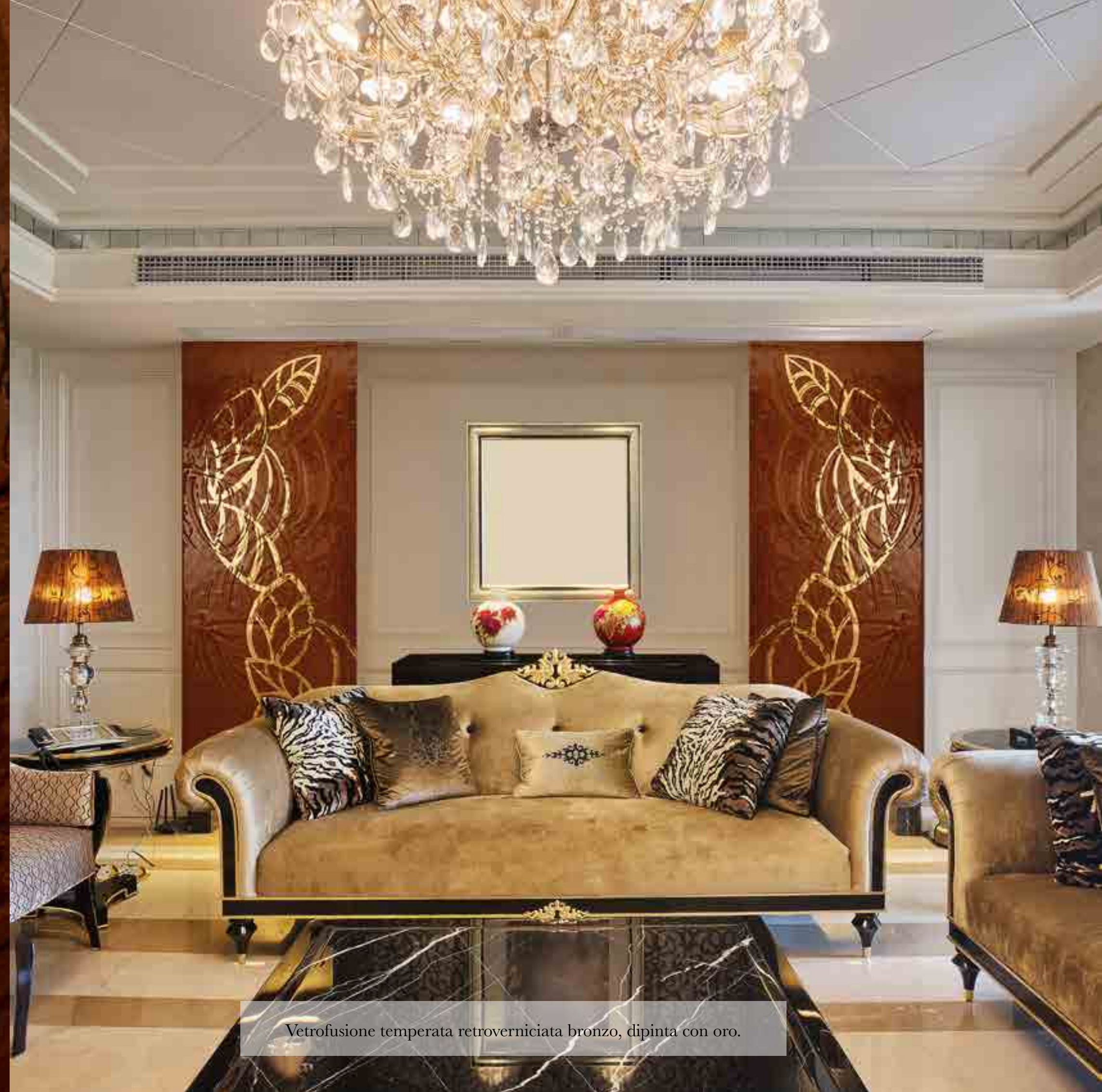
Vetrofusione temperata retroverniciata bronzo, dipinta con oro.