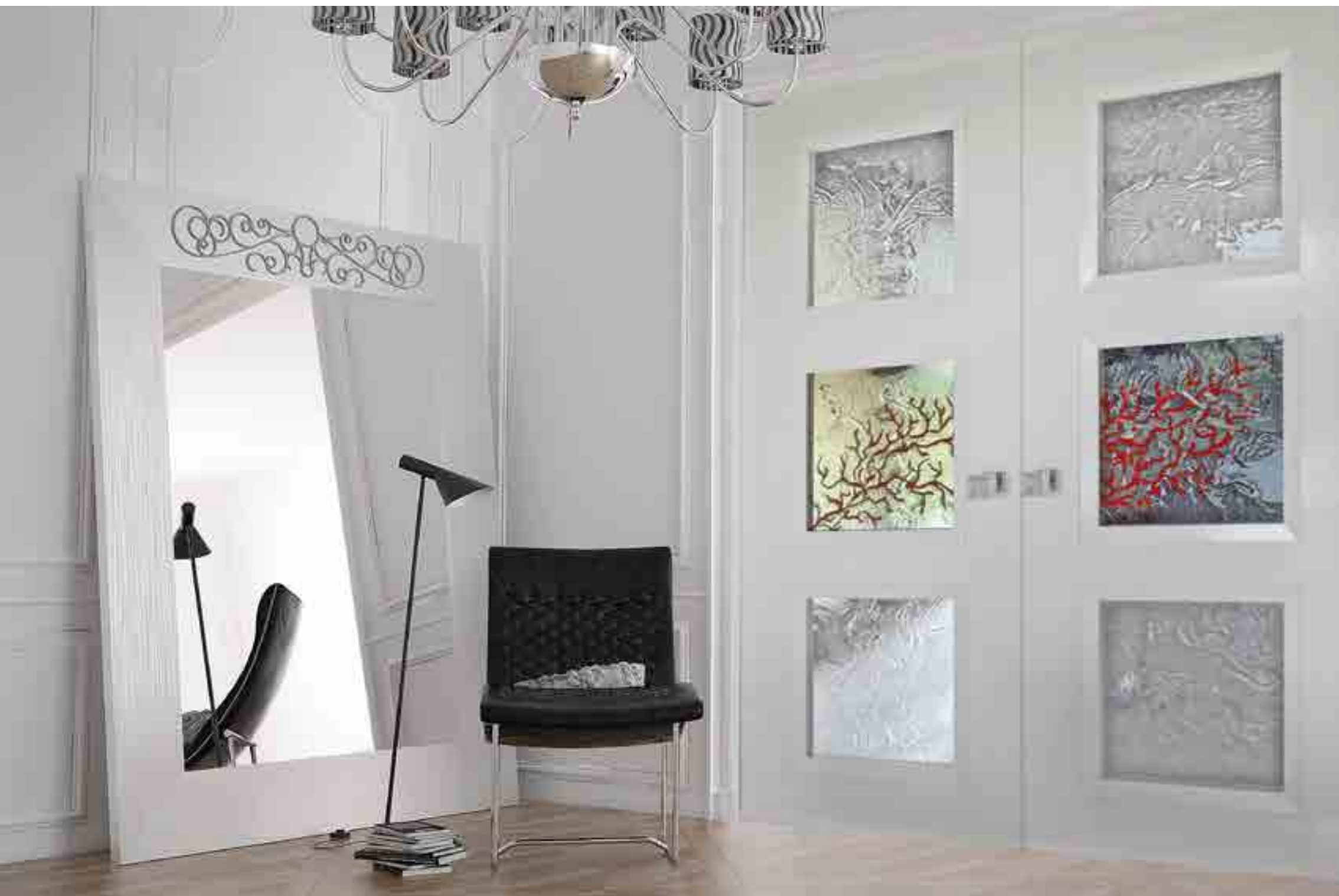
Vetrofusione temperata neutra, decoro stile natura.