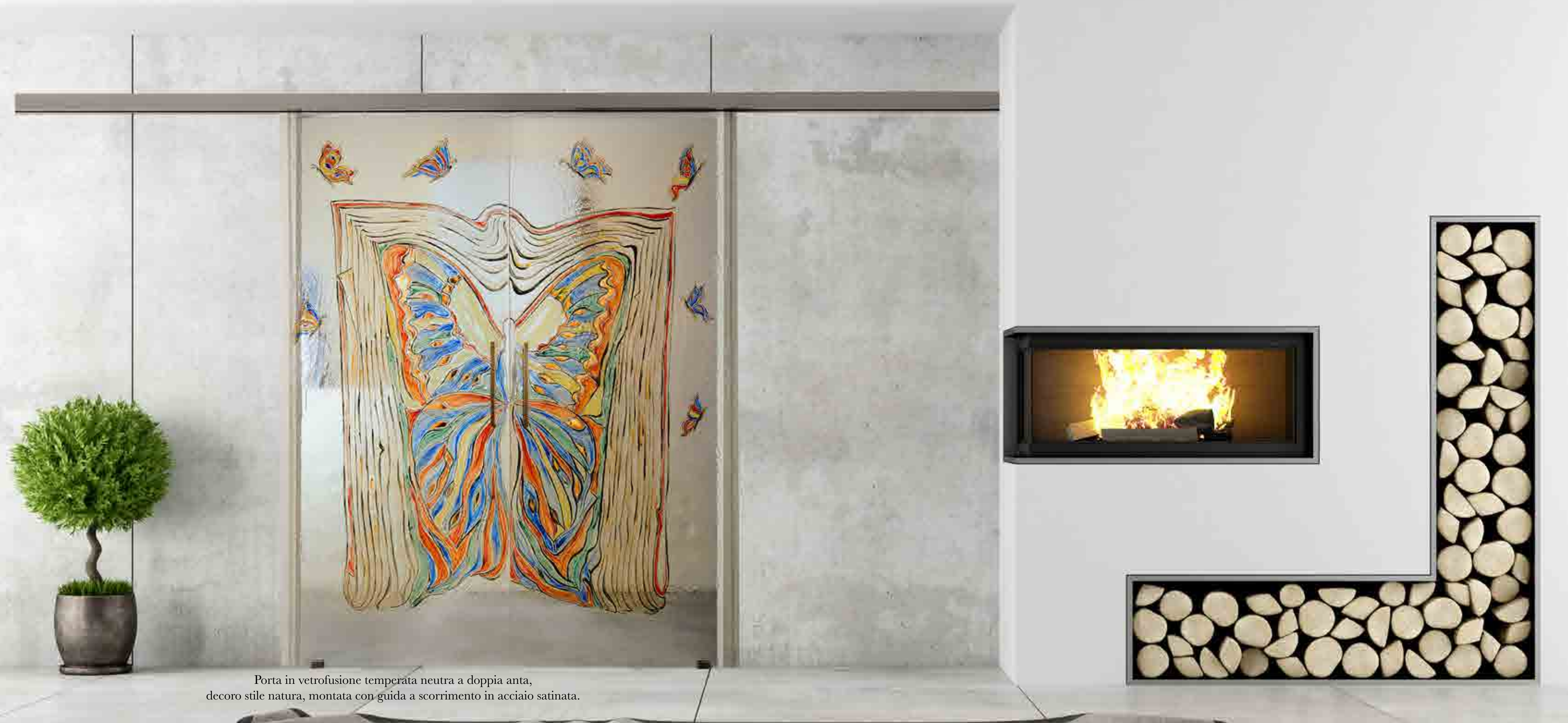
Porta in vetrofusione temperata neutra a doppia anta, decore stile natura, montata con guida a scorrimento in acciaio satinata.