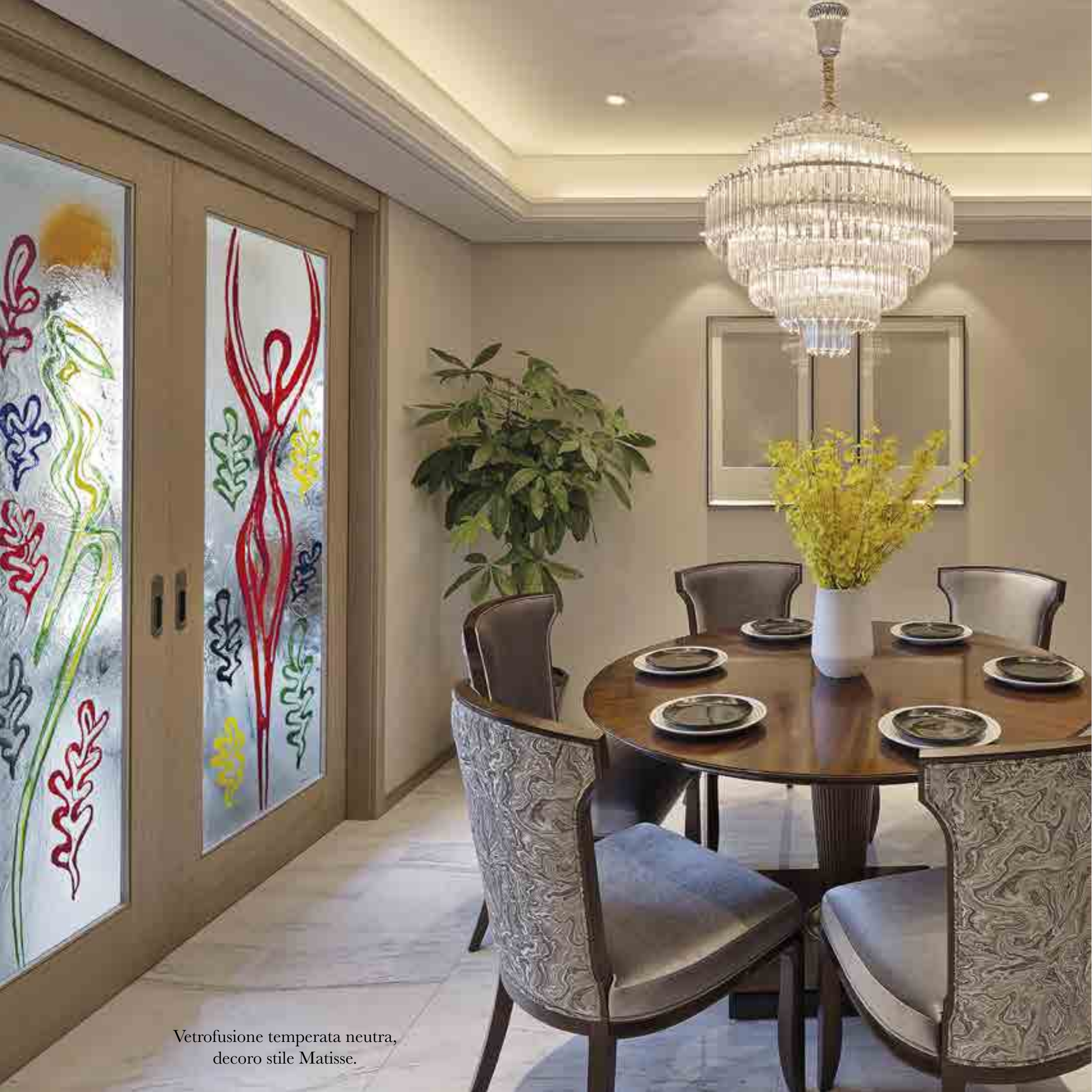
Vetrofusione temperata neutra, deco stile Matisse.