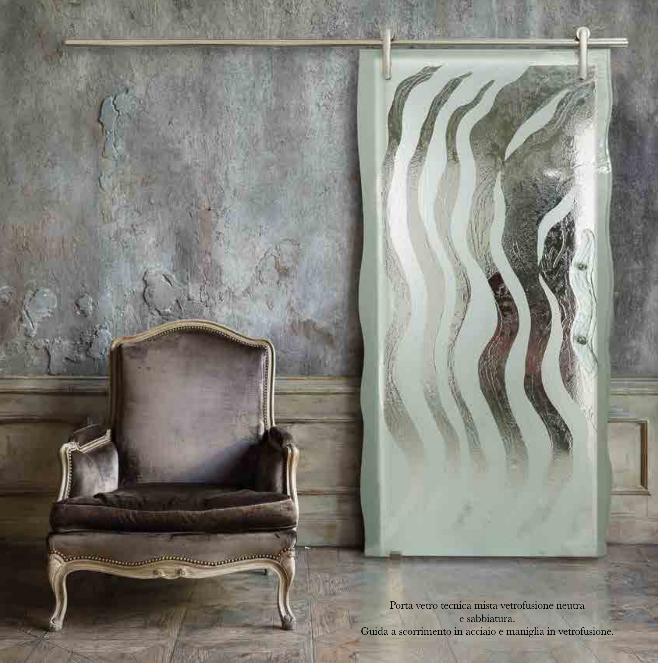
Porta vetro tecnica mista vetrofusione neutra e sabbiatura. Guida a scorrimento in acciaio e maniglia in vetrofusione.