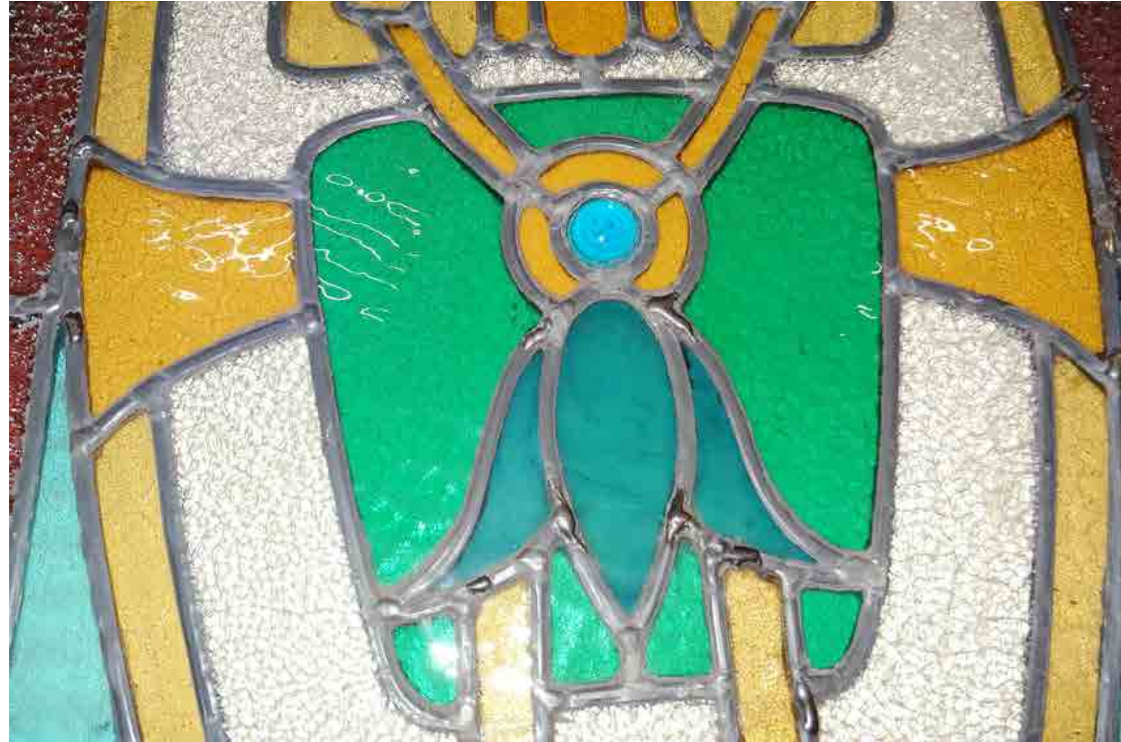
Particolare di restauro di vetrata a piombo.