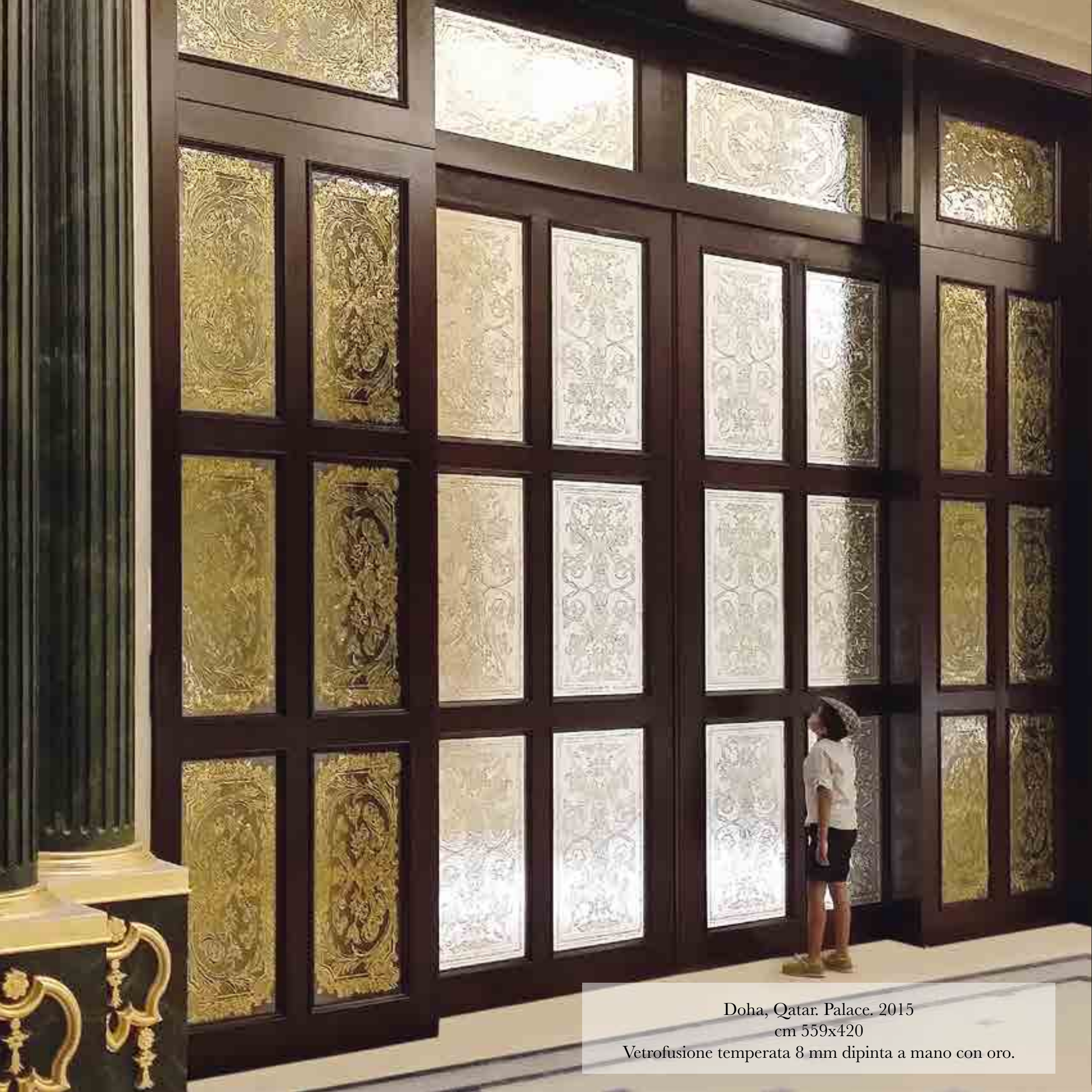
Doha, Qatar. Palace. 2015 cm 559x420 Vetrofusione temperata 8 mm dipinta a mano con oro.