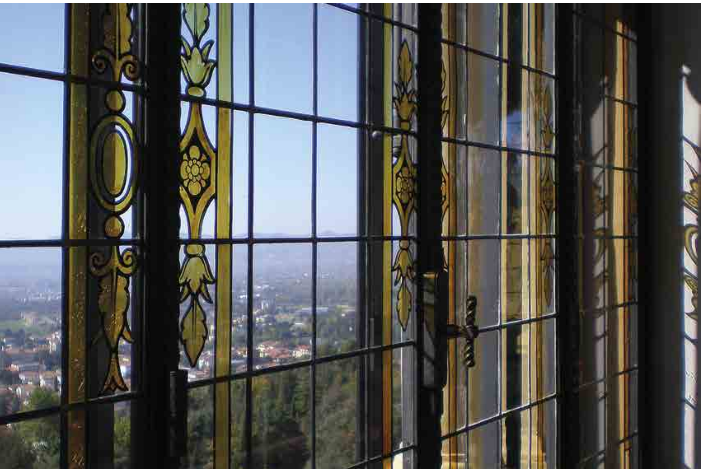
Vetro rilegato a piombo con decori.