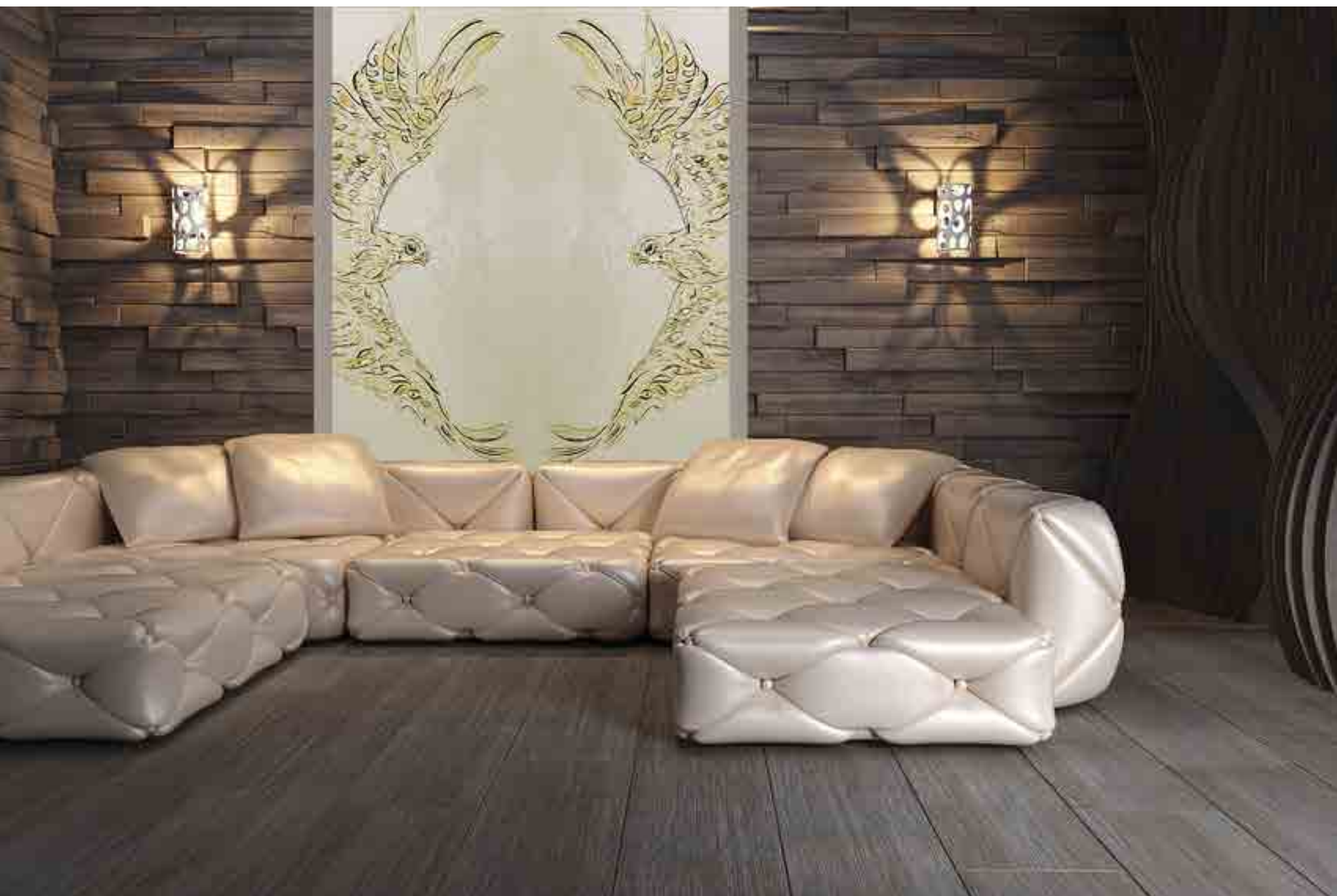
Vetrofusione temperata neutra dipinta in oro.